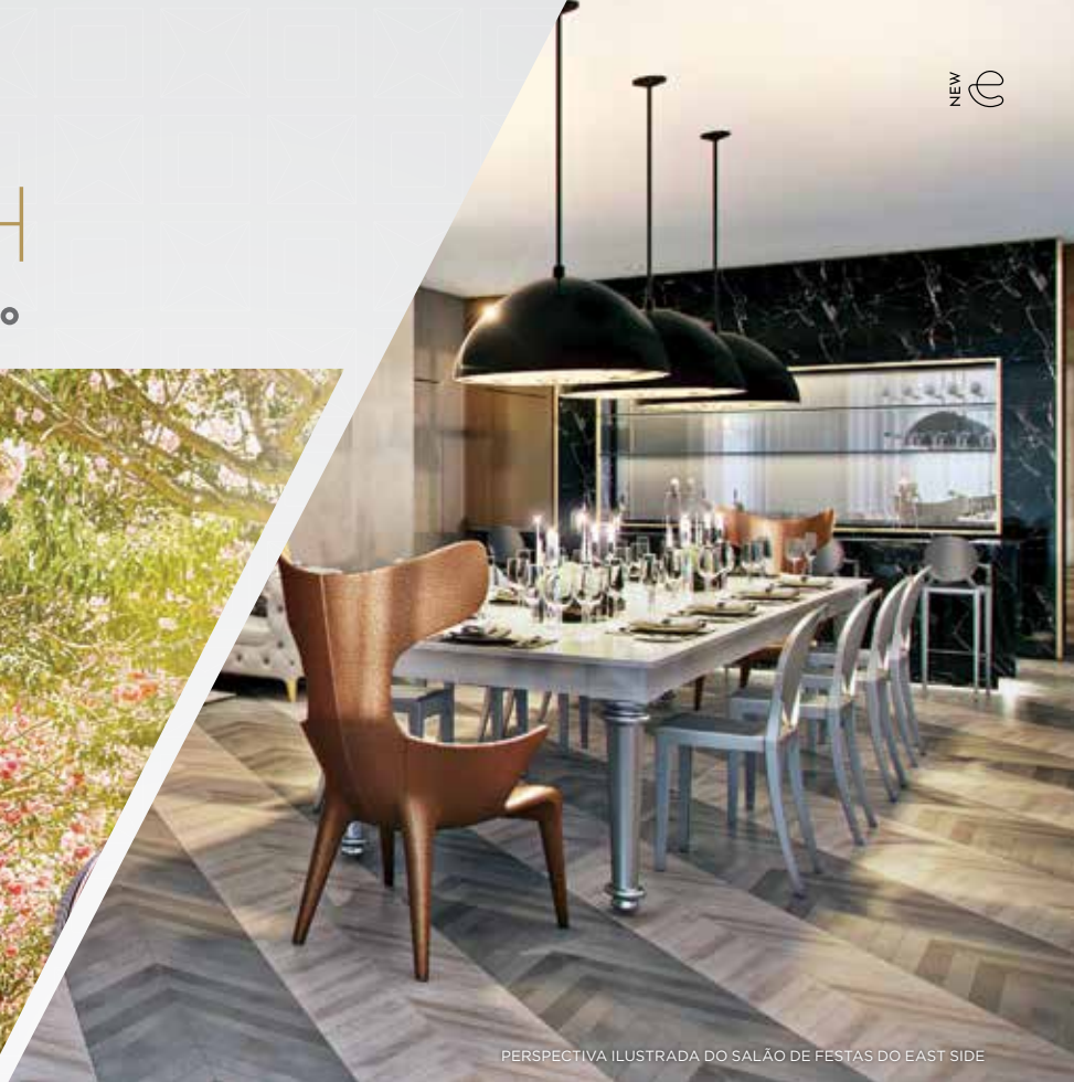
PERSPECTIVA ILUSTRADA DO SALÃO DE FESTAS DO EAST SIDE