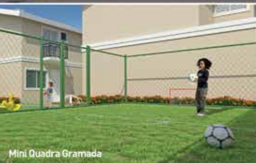
Mini Quadra Gramada