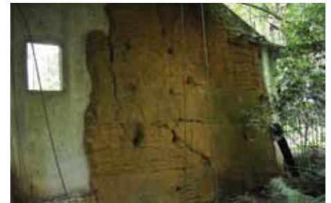
Ruínas em Taipa de Pilão