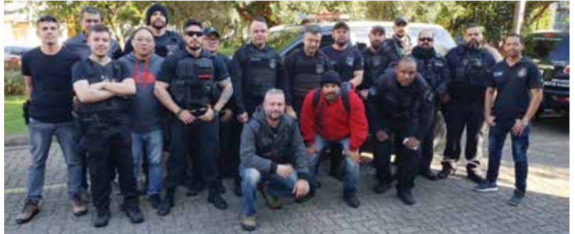
Força Tarefa Policial

A Segurança Pública na circunscrição do 99º Distrito Policial, região do Campo Grande que, como Santo Amaro e Campo Belo, integra o Subdistrito de Santo Amaro, rico em história, esportes, lazer, comércio e instituições de ensino, tem estado no noticiário e nas redes sociais de grupos da região.