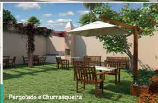
Pergolado e Churrasqueira