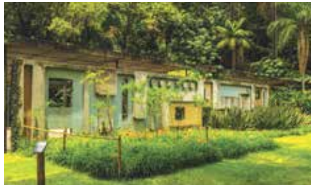
Chácara Tangará por Burle Marx

Pouco se sabe desta antiga construção, uma edificação típica de meados do século XVIII, em taipa de pilão, com técnica construtiva, de paredes grossas e anterior à alvenaria. Possui três compartimentos, um maior que seria propriamente a capela, um conjugado à primeira citação, que pode ter sido sacrário, o