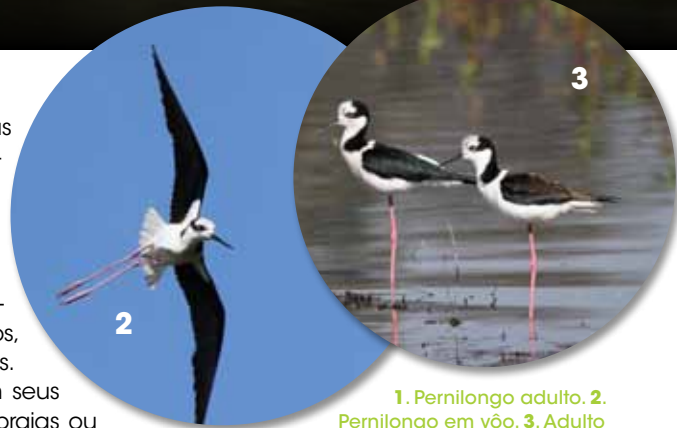
1. Pernilongo adulto. 2. Pernilongo em voo. 3. Adulto e juvenil de pernilongo-de-costas-brancas.

Para diferenciar as duas espécies de pernilongos, é só observar a coloração das costas, próximo da base do pescoço. Num deles, essa parte é toda preta e no outro apresenta uma faixa branca.