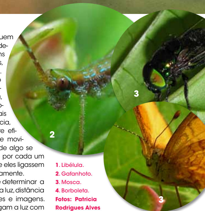
1. Libélula. 2. Gafanhoto. 3. Mosca. 4. Borboleta.

olhos dos insetos possuem milhares de omatídeos, enxergam imagens como o que, para nós, seria um mosaico. Este formato de olho não permite uma imagem nítida, detalhada, nem consegue focar objetos que estejam a mais de um metro de distância, porém, é extremamente eficiente na detecção de movimentos. O movimento de algo se deslocando é captado por cada um dos omatídeos, como se eles ligassem e desligassem, sucessivamente. O olho composto pode determinar a intensidade e origem da luz, distância até um objeto, padrões e imagens. Como os insetos enxergam a luz com comprimento de onda maior que o da luz violeta, enxergam luzes e cores que não são visíveis ao olho humano. Insetos predadores como as libélulas, que caçam suas presas durante o voo, possuem olhos compostos com mais de trinta mil omatídeos; os que precisam de pouca luz, como gafanhotos e louva-deus, têm menos omatídeos, porém a luz se concentra em apenas um deles, que distribui a luz pelo resto do olho. Muitas vezes percebemos uma mancha preta nos olhos de alguns insetos, como se eles estivessem "olhando" para nós. Na verdade esta mancha é o alinhamento de um grupo de omatídeos, justamente na direção que requer sua atenção. A estrutura do olho composto vem sendo estudada pela medicina e aplicada no desenvolvimento de micro câmeras que podem ser "engolidas" pelos pacientes e, pelas inúmeras imagens geradas, obter o diagnóstico de forma muito mais segura e eficaz. Isso tudo, por causa de uma foto...adoro esses "Monsters"!