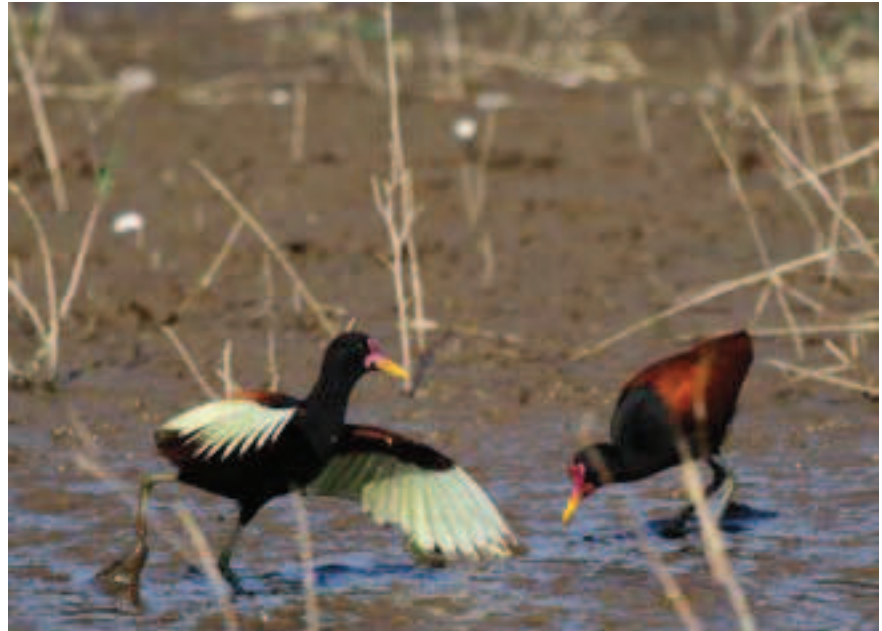
Jaçanã se exibindo

O jaçanã também é conhecido como piaçoca, menininho-do-banhado (RS), enxofre ou casaca-de-couro (MG), marrequinha (BA) e cafezinho, um dos nomes mais comuns no interior do Brasil, como no Pantanal. Constrói seu ninho em cima de folhas de algumas plantas aquáticas, como a ninféia. O macho que choca os ovos. Os filhotes são nidífugos, ou seja, logo após o nascimento já